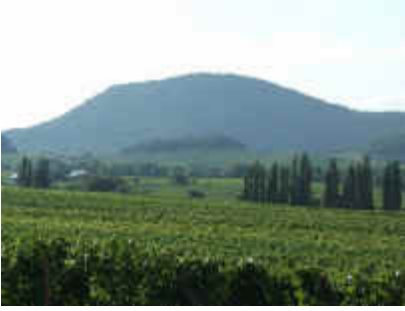
An der südlichen Weinstrasse