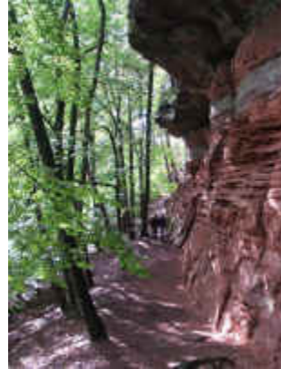
Am östlichen Altschlossfelsen