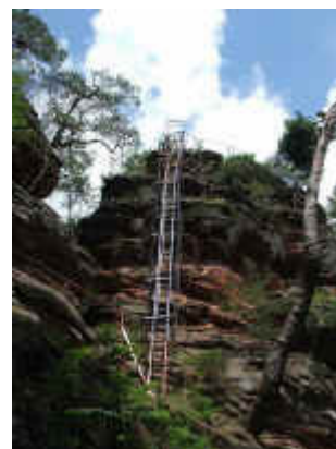
Himmelsleiter zum Lanzenfahrter Felsen