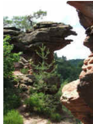
Felsenrast am Kurzen Dämpfel

An der Hütte wenden wir uns nach Osten [ Lokalmarkierung 11 , am Beginn auch grün-weißes Logo des Pfälzer Waldsteiges]. Die Route zweigt schon nach zwei Minuten vom zunächst breiten Weg ab auf einen abwärts führenden Pfad, der auf eine etwas knifflige Wegspinne