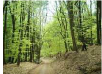
Frisches Buchenlaub am Stäffelsberg