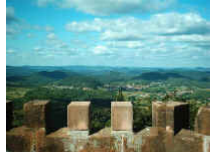
Wasgau vom Rehbergturm