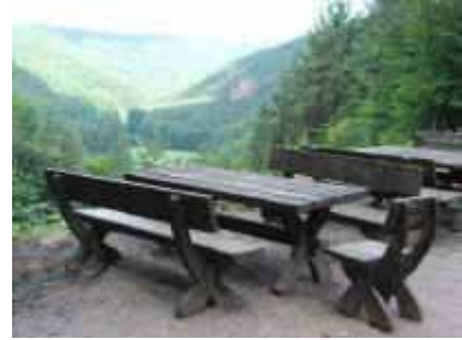
Vom Wanderheim Dicke Eiche ins Stephanstal