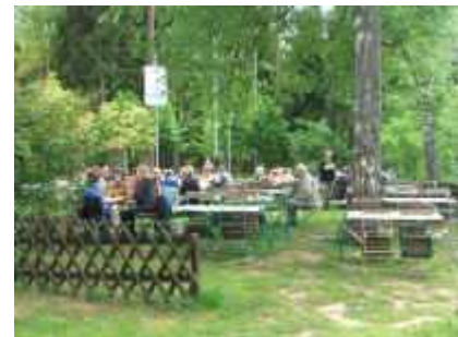
Rast an der Dahner Hütte