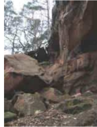
Felssturz an den Hohlen Felsen