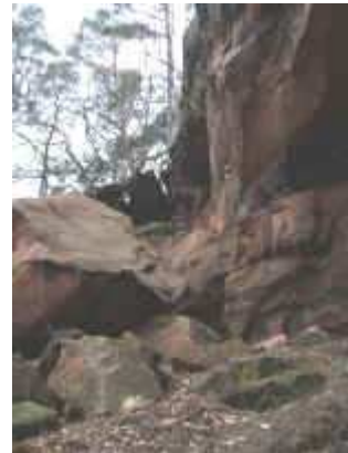
Felssturz an den Hohlen Felsen