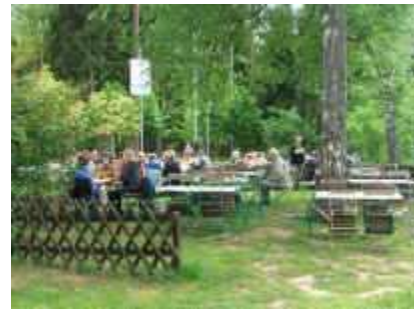
Rast an der Dahner Hütte