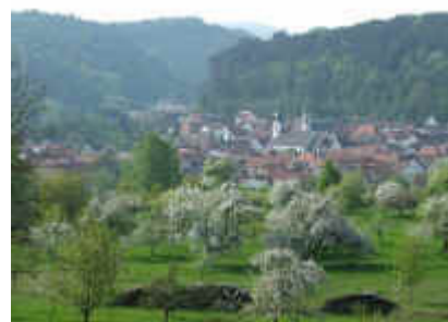
Dahn vom Ehrenfriedhof