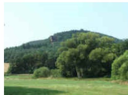
Aus dem Scharbachtälchen zum Dickenberg mit dem Sprinzelfelsen