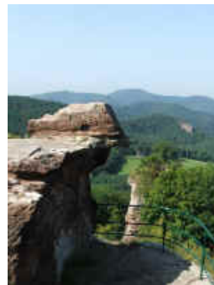
Auf der Burgruine Drachenfels