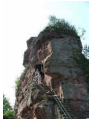
Aufstieg zur obersten Plattform des Drachenfels