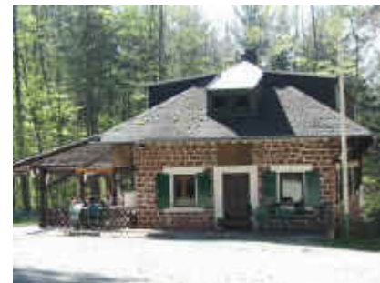
Waldhaus Drei Buchen