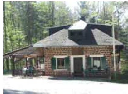
Waldhaus Drei Buchen