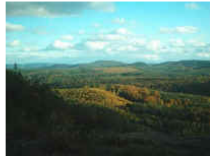
Vom Langmühlblick in den Wasgau