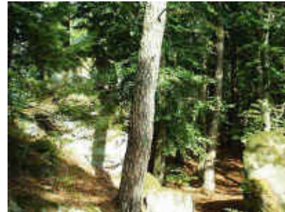
Auf dem Weg zum Maiblumenfels