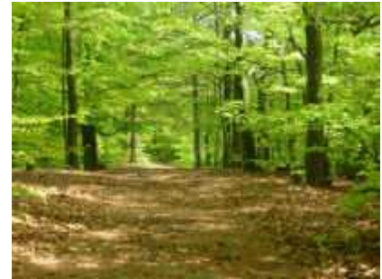
Buchengrün auf dem Langenberg-Höhenweg