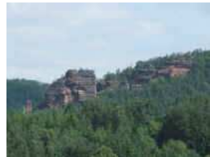
Der Spirkelbacher Rauhfels von Süden