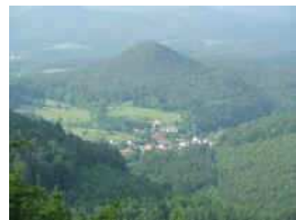
Von der Hohenburg nach Nothweiler