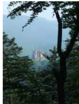
Fleckenstein von der Hohenburg